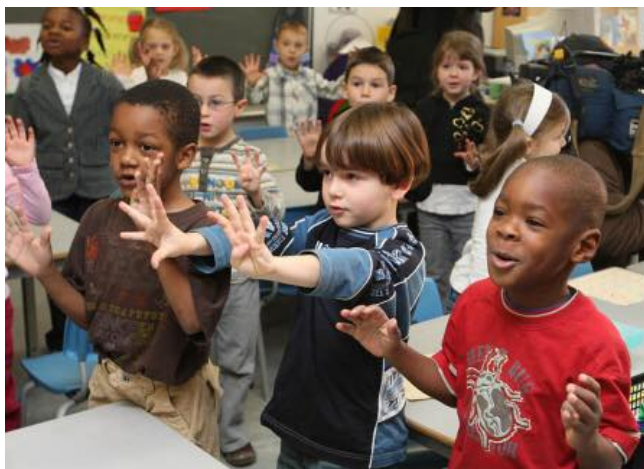
18,5% des 73 093 élèves (FGJ) EHDAA; 1/2 pas le français comme langue maternelle. 69% défavorisés

La CSDM possède des caractéristiques particulières, notamment la diversité culturelle de sa population et la défavorisation d'une grande partie de celle-ci. Tous les quartiers du territoire de la CSDM comptent des milieux défavorisés, que ce soit des enclaves de pauvreté à l'intérieur de quartiers mieux nantis ou des quartiers dans lesquels la défavorisation est généralisée. Le territoire du centre-ville n'échappe pas à la règle, d'est en ouest, du secteur de Sainte-Marie à celui de Peter-McGill.