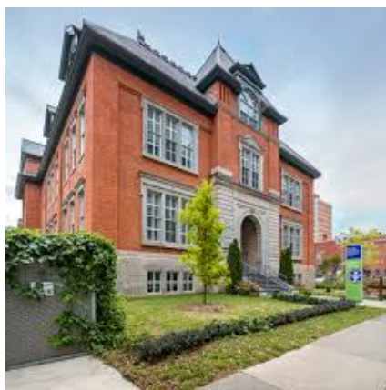
École des métiers de la restauration et du tourisme de Montréal

Au cours des six dernières années scolaires, la CSDM a poursuivi l'analyse approfondie de la capacité d'accueil des écoles de son territoire, dont celles du centre-ville de Montréal. Nous avons à l'heure actuelle cinq écoles primaires de quartier localisées dans le secteur de Sainte-Marie, dont la population ne cesse de croître : l'école primaire et secondaire FACE (en cohabitation avec la Commission scolaire English-Montréal), une école sans territoire qui accueille uniquement des élèves avec un intérêt pour les arts; l'école secondaire Pierre-Dupuy, contiguë à l'École des métiers des Faubourgs-de-Montréal, dans laquelle est hébergée l'École des métiers de l'horticulture de Montréal; l'École des métiers de la restauration et du tourisme de Montréal; les centres Gédéon-Ouimet et Lartigue, l'un pour les adultes, l'autre pour la francisation.