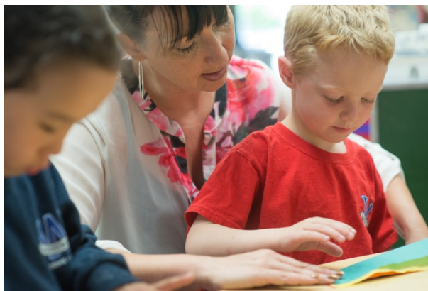
La réussite scolaire, une responsabilité partagée