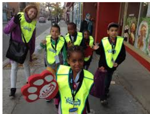
Des élèves du primaire se rendent à l'école à pied accompagnés de parents ou membres du personnel.

Lorsqu'il est question de mobilité urbaine, d'autres aspects viennent à l'esprit : le déplacement actif (marche, vélo, patin à roues alignées, planche à roulettes, etc.) et les infrastructures nécessaires (trottoirs, sentiers pédestres, pistes cyclables, passages piétonniers, couloirs scolaires, éclairage, feux de circulation, panneaux, services policiers, etc.). L'un favorise la pratique d'activités physiques par les citoyens, jeunes et adultes, les autres sont requises pour assurer des déplacements en toute sécurité.