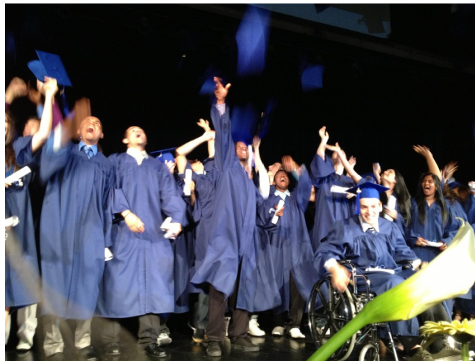
Finissants de l'école secondaire Pierre-Dupuy 2012-2013

La réussite et la persévérance scolaires des adolescents constituent un défi pour la CSDM. En effet, il s'agit d'une étape particulièrement fragile pour certains jeunes qui ont du mal à persévérer. Il s'agit d'une période de leur vie où ils vivent des changements importants, voire des moments charnières, dont le passage du primaire au secondaire n'est que le début. La CSDM se préoccupe particulièrement de ces élèves. Par conséquent, dans son plan Réussir, elle a retenu plusieurs moyens prioritaires à mettre en œuvre pour maintenir la motivation de ces jeunes jusqu'à l'obtention de leur diplôme. Ce plan tient également compte des préoccupations de la CSDM à l'égard des besoins des jeunes handicapés ou en difficulté d'adaptation ou d'apprentissage (HDAA).