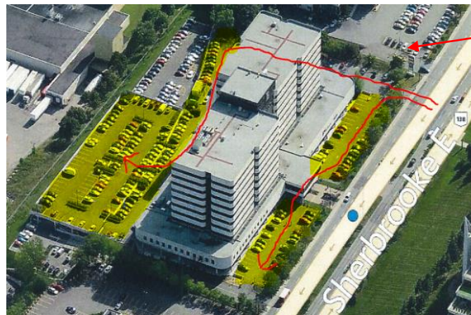
Hôtel Universel Montréal