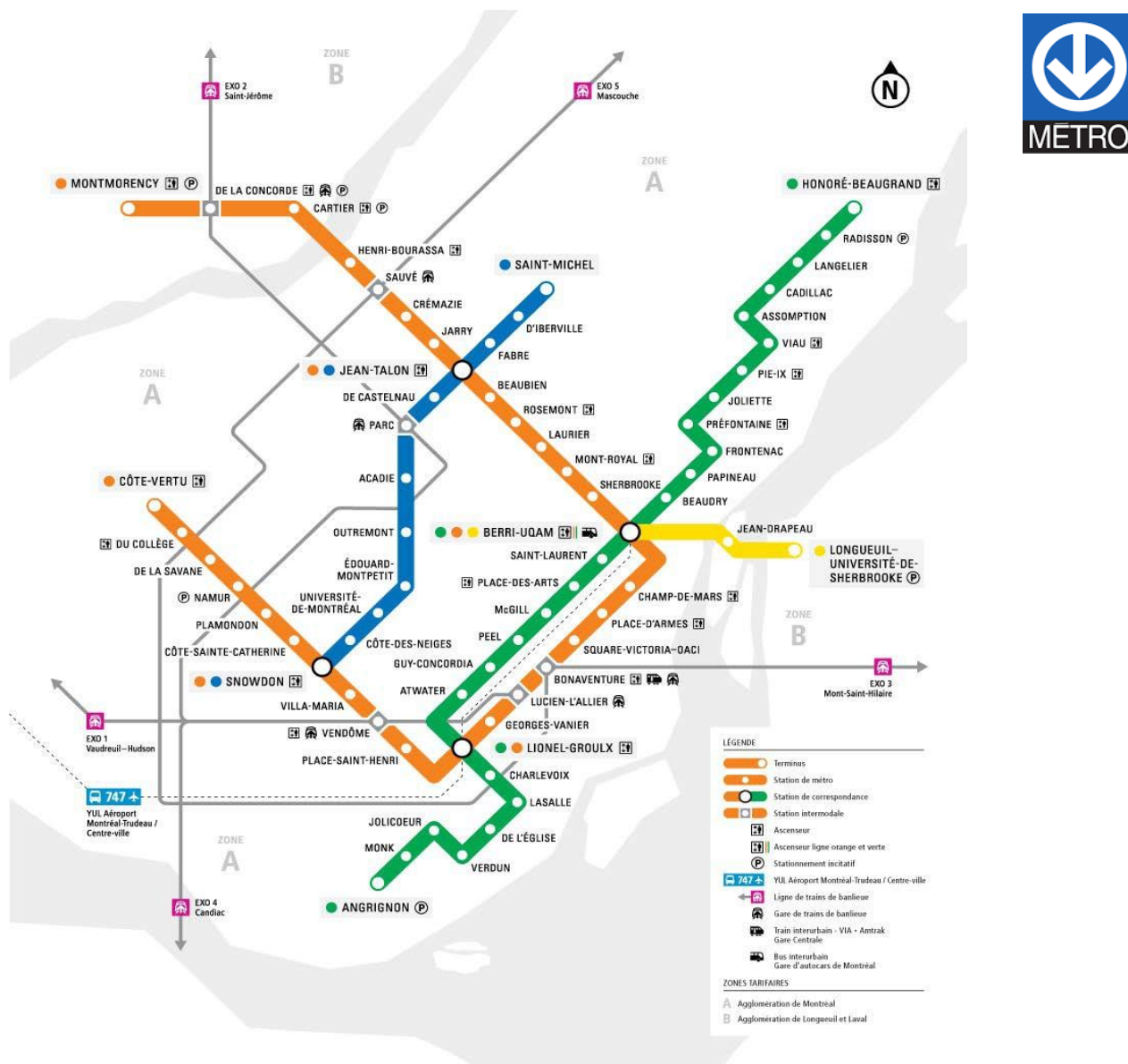
Plan du métro de Montréal

La société de transport de Montréal (STM) est une entreprise publique de transport collectif au cœur de la région de Montréal. Elle compte plus de 151 lignes d'autobus et de 68 stations de métro qui vous permettent de vous déplacer n'importe où à travers la ville de Montréal. https://www.stm.info